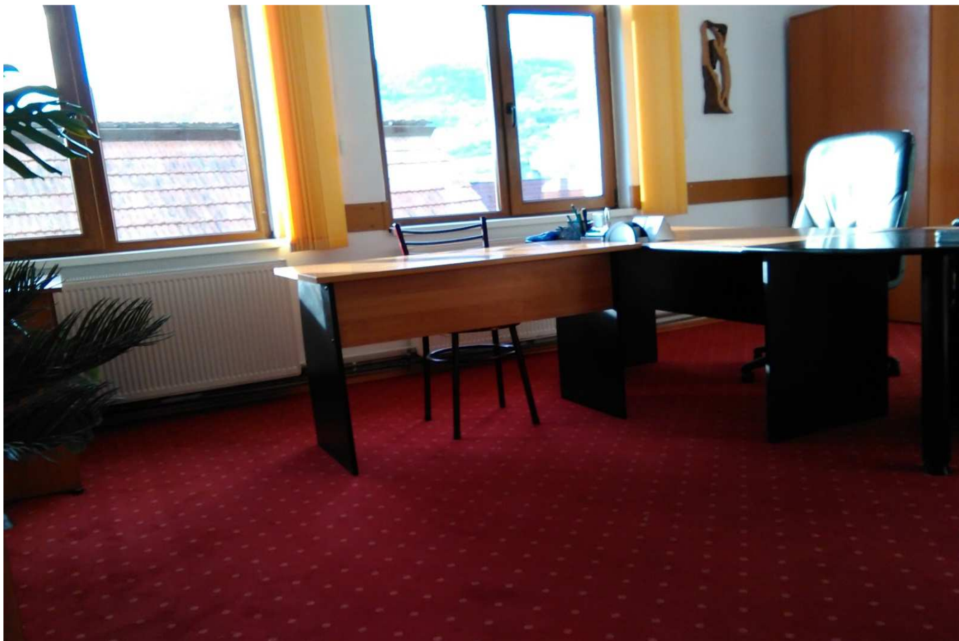
Sala de ședințe Consiliul Local Perișani